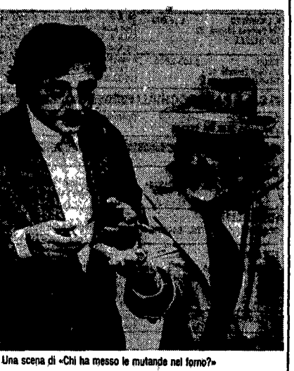
Una scena di «Chi ha messo le mutande nel forno?»