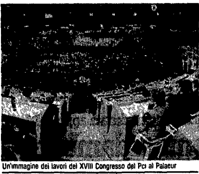
Un'immagine dei lavori del XVIII Congresso del Pci al Palazzo

so soddisfatto della revisione compiuta dal Pci sul suo passato storico (il 20,3% non lo è).