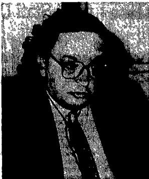
Gianni De Michelis