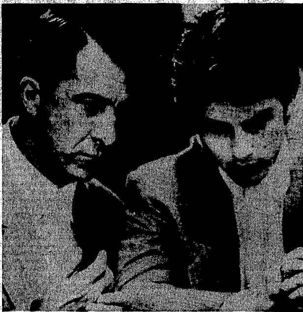
Dustin Hoffman e Tom Cruise in «Rainman» il film favoritissimo agli Oscar.