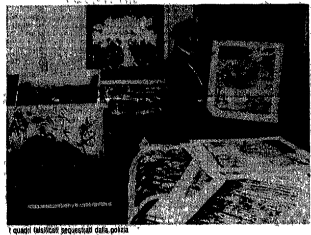
I quadri falsificati sequestrati dalla polizia