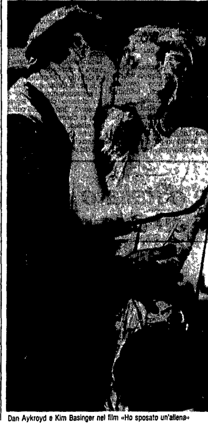
Dan Aykroyd e Kim Basinger nel film «Ho sposato un'allena»