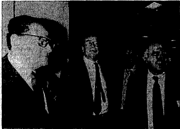
Craxi al congresso dell'Uds tra Longo, Intini e Romita

che «anche nel Pci sono stati gettati i semi per un cambiamento che dovrà venire...»