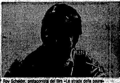
Roy Scheider, protagonista del film «Le strade della paura»

Primecinema. Con Roy Scheider Vecchio killer, sei finito