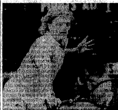
Boris Becker, ieri sconfitto a Montecarlo