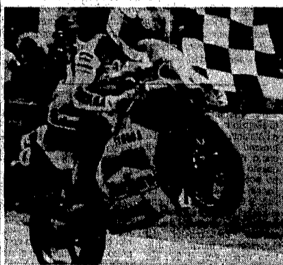
Luca Cadalora vittorioso mentre taglia il traguardo delle 250