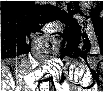
Il sindaco di Palermo Leoluca Orlando