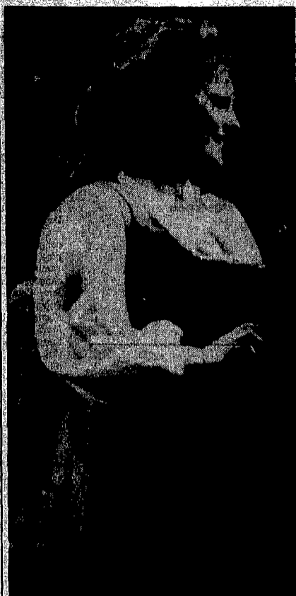
Katia Ricciarelli durante la seconda replica del «Luisa Miller»