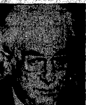
Cossiga domani a Varsavia