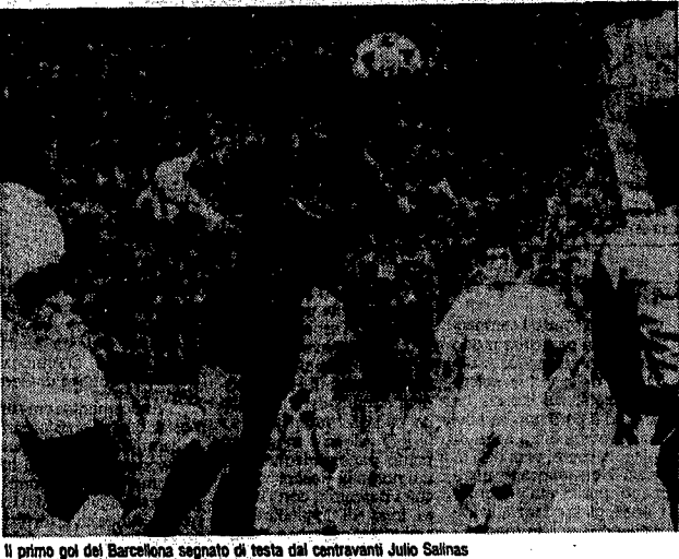
Il primo gol del Barcellona segnato di testa dal centravanti Julio Salinas