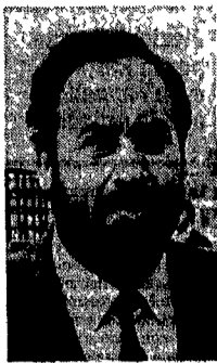
Ottaviano Del Turco