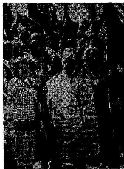
Protesta contro i ticket a Roma durante lo sciopero generale