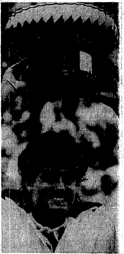
Gabriela Sabatini alza il trofeo della vittoria romana