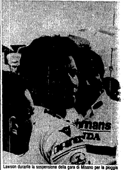
Lawson durante la sospensione della gara di Misano per la pioggia