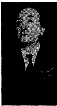
Ciriaco De Mita