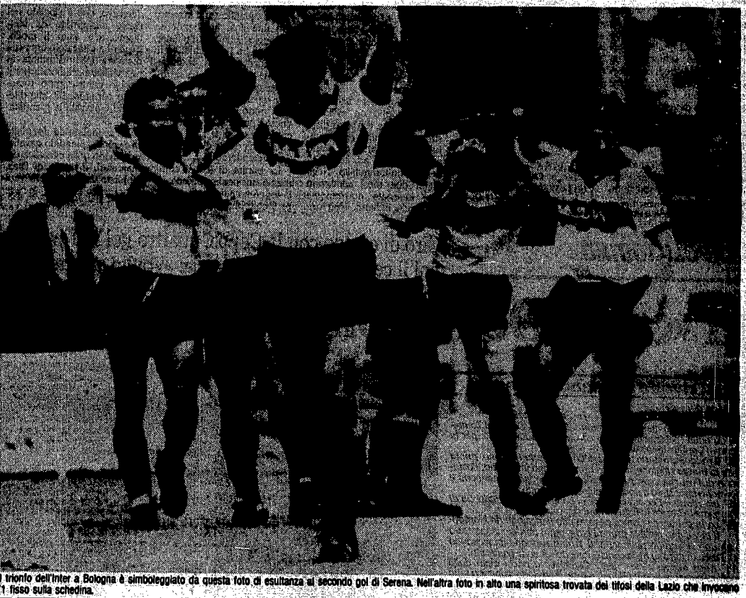
Il trionfo dell'Inter a Bologna è simboleggiato da questa foto di esultanza al secondo gol di Serena. Nell'altra foto in alto una spiritosa trovata dei tifosi della Lazio che invocano l'11 fisso sulla schedina.