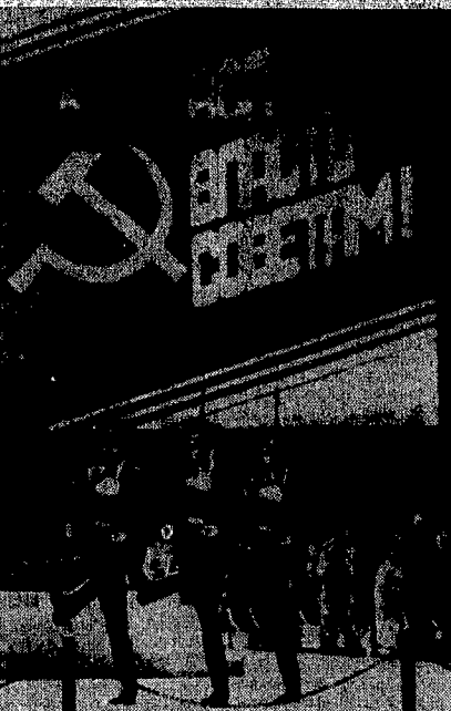
Guardie del Cremlino davanti alla gigantografia. «Tutto il potere al Soviet», si legge nella piazza Rossa per la sessione inaugurale del nuovo Parlamento sovietico.