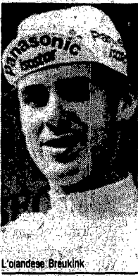
L'olandese Erik Breukink.