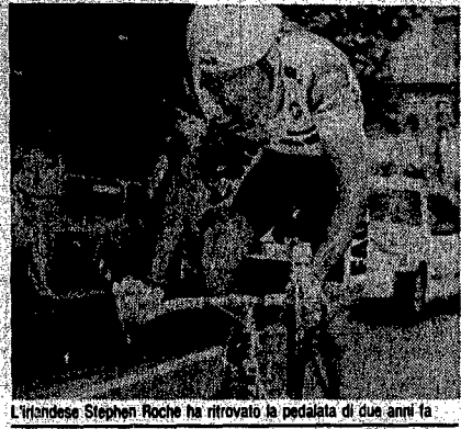
L'Irlandese Stephen Roche ha ritrovato la pedalata di due anni fa.