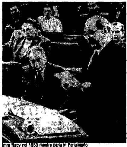
Imre Nagy nel 1953 mentre parla in Parlamento