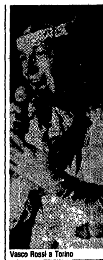
Vasco Rossi a Torino

Inutile chiedergli quale sia la sua canzone preferita si riceve inevitabilmente una non risposta. «Come si fa? Le canzoni sono come i figli non è permesso avere preferenze sono tutti belli». Ed anche le nostalgie legate ai Beatles quelle che fanno sempre pensare a McCartney come se avesse lasciato il gruppo solo l'altro ieri, in fondo non gli pesano. «I Beatles hanno avuto un tale successo che è difficile che la gente possa dimenticarsi. Quando si sono sciolti ho sperato che la gente si concentrasse sulla mia camera solista e lì mettesse da parte ma oggi sono contento di avere fatto parte. È un po' come per Charlie Chaplin anche da vecchio quando viveva in Svizzera tutti continuavano a ricordarlo come Charlie l'ormo dalla buffa camminata. Di un fenomeno famoso la gente continuerà sempre a ricordare l'immagine. E io sono contento tra l'altro che lui e io abbiamo imitato negli anni Sessanta cose come i ecologisti e la lotta per la pace fac-