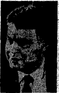
La peseta spagnola è entrata nello Sme

La peseta, la moneta spagnola, è entrata nello Sme, il sistema monetario europeo, con una banda di oscillazione del 6%, pari, cioè, a quella allargata della lira e della sterlina irlandese. L'annuncio è stato dato ieri sera, a Bruxelles e a Madrid contemporaneamente, al termine di una riunione nella capitale belga del Comitato monetario Cee, organo consultivo comunitario. Il ministro delle Finanze spagnolo Carlos Solchaga ha detto: «È la decisione più importante dopo l'adesione della Spagna alla Cee». Nella foto il primo ministro spagnolo Felipe Gonzalez.