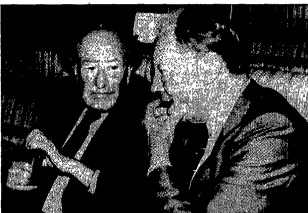
L'ex premier austriaco Kreisky a colloquio con Willy Brandt