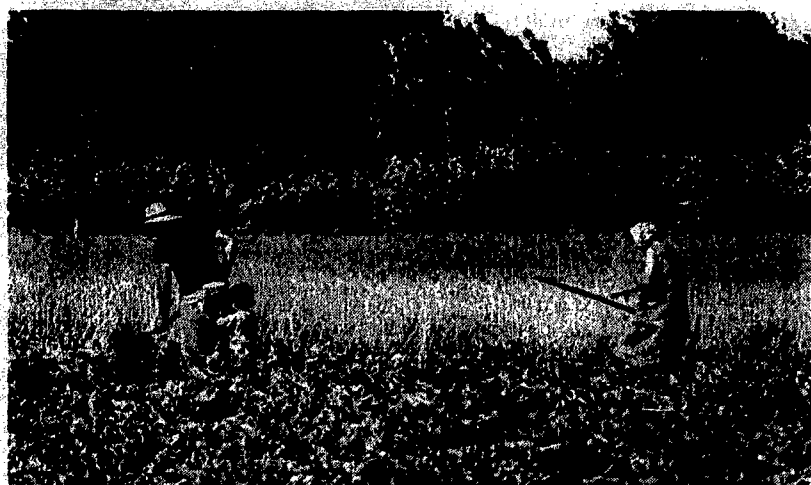
La cooperazione ravennate si sta impegnando in vari settori produttivi, dal tradizionale comparto agricolo al più innovativo, porto compreso.