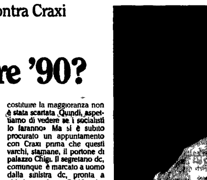
Il segretario repubblicano Giorgio La Malfa