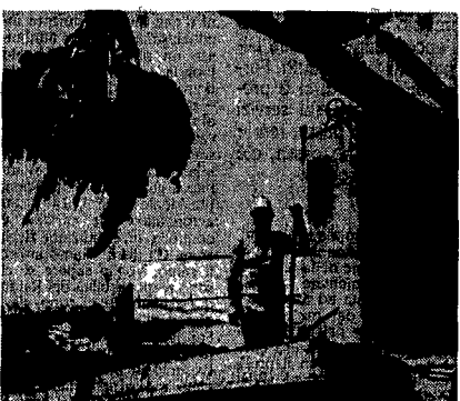
Raccolta delle alghe nell'Adriatico