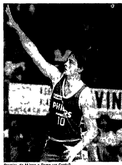
Premier da Milano a Roma via Cantù?

Liste aperte fino a venerdì sera nel mercato del basket quelle che mancano però sono le trattative e gli affari conclusi tra le società di serie A. L'unico trasferimento di una certa importanza potrebbe essere quello di Premier «braccato» dal Messenger di Roma. Oggi, intanto, presentazione del torneo Open che si svolgerà a Roma in ottobre con Barcellona, Jugoplastika, Denver Nuggets e Philips.