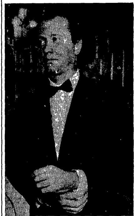
Brasile in crisi: sarà Falcao il prossimo citta?

novela Viali» (una storia infinita che va avanti ormai da tre anni fra incredibili scoop e pentimenti dietrofront) la Sampdoria (o se preferite Mantovani) non si era mai preoccupata di smentire certe notizie clamorose. Il suo ventiduenne (ma mai verificato) passaggio al Milan o al Napoli. Ma anche un messaggio preciso Viali non si tocca come nessun gioiello di casa blucerchiata. Ed anzi la Sampdoria ha intenzione di rinforzarsi. Ha già acquistato Lombardo altro gioiello cremonese (si ripeterà la storia di Viali?) Apolloni (dal Parma) Invernizzi (dal Como) e il portiere Zinetti (buono per la panchina) dal Pescara. Ma il grosso colpo dovrebbe essere concluso giovedì quando Mantovani partirà per l'Inghilterra alla caccia dello scozzese McMahon. L'acquisto del forte centrocampista del Liverpool viene dato ormai per sicuro. In casa dei «Reds» inglesi è stata accettata l'offerta di due milioni e mezzo di sterline (quasi quattro miliardi di lire). Manca solo l'assenso del general manager (l'equivalente in Italia dell'allenatore) Kenny Dalglish. In un primo tempo il tecnico non voleva sentire ragioni. Ma ora non sembra più un transigente. L'offerta blucerchiata (che ha convinto i dirigenti del Liverpool) deve aver ridotto a più miti consigli anche lui McMahon. Il portiere arriverà e sarà lui il centrocampista di peso chiesto da Viali per una Sampdoria non più buona solo per la Coppa Italia ma in grado di competere per lo