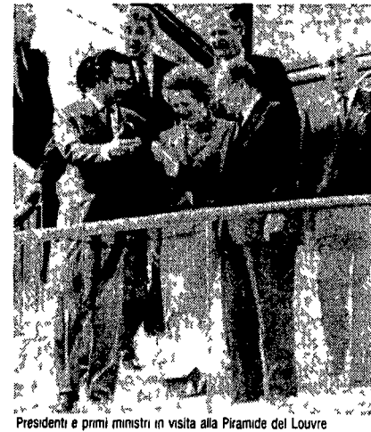
Presidenti e primi ministri in visita alla Piramide del Louvre