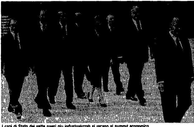
I capi di Stato dei sette paesi più industrializzati si recano al summit economico