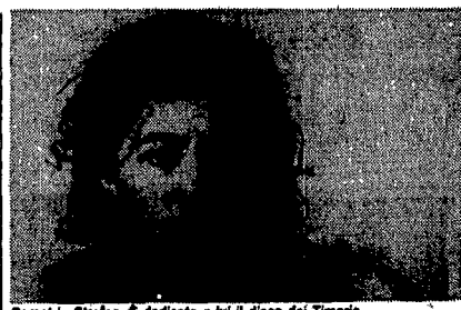
Demetrio Stratos. È dedicato a lui il disco dei Timoria

Comunque il suo prossimo set sarà negli Stati Uniti. «Racconterò una storia ambientata nella Hollywood del muto. La vicenda di un attore giapponese si chiama Ajakala, che diventa amico di Rodolfo Valentino. Il film tratterà la relazione tra i due attori e i loro rispettivi rapporti con le donne dell'epoca. Si concluderà con i funerali di Valentino. Credo, spero, che piacerà anche in Giappone, dove oggi la gente ha smesso di guardarsi dentro, di specchiarsi, come aveva incominciato a fare dopo la sconfitta nel nostro terribile dopoguerra. Penso che ciò avvenga, perché ora le facce sono diventate molto brutte. Anche per questo ora è difficile fare dei film autentici in Giappone. I film mostrerebbero quello che fanno mentre oggi il mio paese sta andando avanti, molto avanti ma alla cieca».