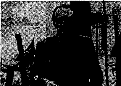
Heiner Müller, un suo testo è andato in scena a Chieri