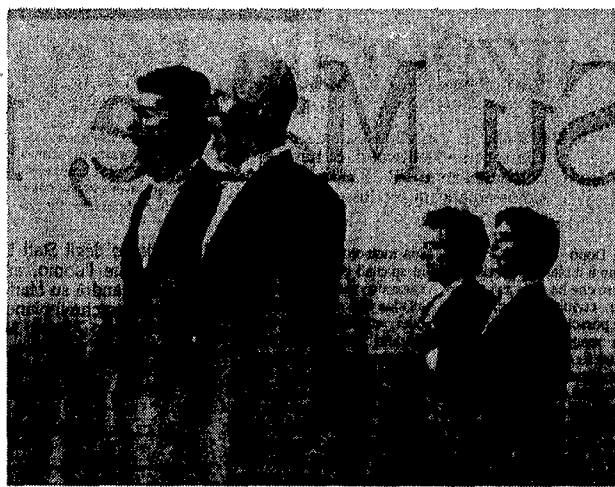
«Durante la costruzione della muraglia cinese», il nuovo spettacolo di Barberio Corsetti

torre, una babele che dovrebbe rappresentare un po' coscienza e conoscenza della società. Ma questa stessa società è indecisa, incerta: meglio aspettare la seconda, la terza generazione per costruire la torre. Chi verrà poi, avrà sicuramente più scienza per costruirne una torre perfetta. Il senso, sottolinea Barberio Corsetti, non è soltanto nella forza inutilità di questa o quella generazione, quanto nell'incapacità di vivere con gli altri, nella vaghezza intrinseca del concetto stesso di convivenza sociale. Così in scena, vediamo nove ragazzi in abito nero e camicia bianca (tante riproduzioni, quasi come gli omini di Magritte) che si scontrano, si agitano. All'inizio, come giocando con delle tavole di legno, cercano di costruire la torre. Via via, le energie vengono meno: l'esuberanza dei nove si trasforma in violenza, piccole aggressioni quotidiane. Il tutto dosato in scena at-