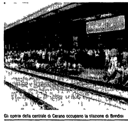
Gli operai della centrale di Cerano occupano la stazione di Brindisi.

Il blocco alla stazione di Brindisi è stato tolto poco dopo mezzogiorno. A drammatizzare la situazione è giunta la notizia di diffusasi in mattinata di un incendio sviluppatosi nella notte tra domenica e lunedì ad un capannone dell'agenzia Enel di San Pietro Vermonec.