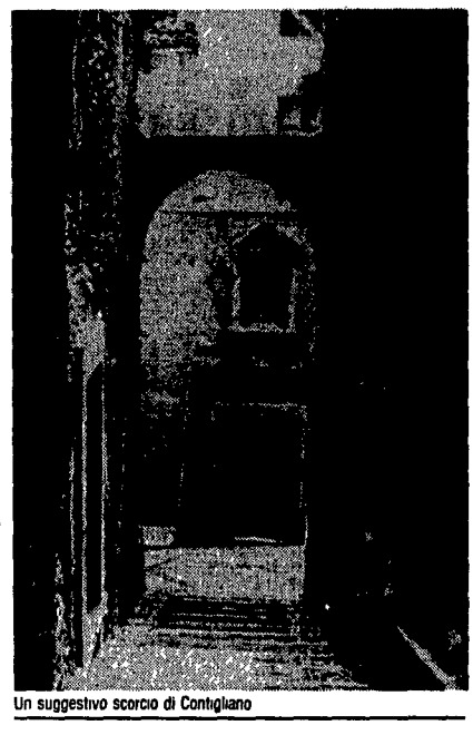
Un suggestivo scorcio di Contigliano