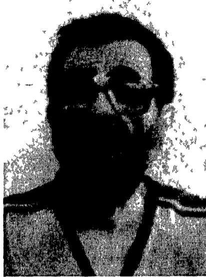
Un'immagine di Ciccipio ripresa dalla videocassetta mandata a Bush