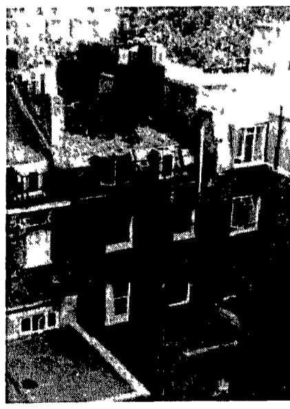
L'albergo londinese distrutto dalla bomba che è esplosa uccidendo l'attentatore