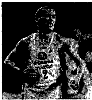
Francesco Panetta campione del mondo sui diecimila metri

Contiamo su Salvatore Antibo senza ombra di dubbio il miglior mezzofondista della stagione sulle distanze lunghe. Il mezzofondo è ricco e infatti presenta oltre ad Antibo che però sarà impegnato sulla distanza che ama meno i cinquemila metri Francesco Panetta sui 10mila metri.