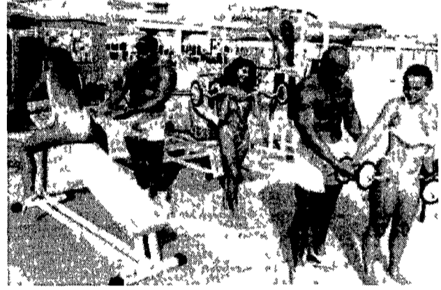
Lezioni di ginnastica sulla spiaggia di Cesenatico. In mancanza del mare

l'ansietà. Nessuno è contento per i recenti provvedimenti del governo. Tantomeno la Confcommercio e la Confesercenti che ieri mattina forse anche per prevenire altre forme di protesta hanno inscenato a Riccione una manifestazione «contro ogni abuso nel commercio e nell'ambiente». A testimoniare l'impegno un