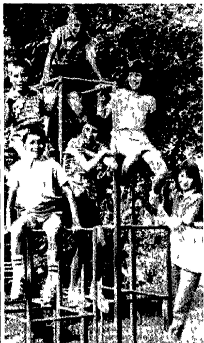
Vacanze al mare anche per i sei fratellini Pegoraro allontanati da casa su ordine del Tribunale dei minori di Venezia. Trascorrono agosto presso la colonia estiva «Monte Bianco» di Jesolo

Gli acquazzoni un po' ovunque hanno rinfrescato la partenza degli ultimi ritardati. Ancora ieri mattina sulle principali arterie stradali il traffico era molto intenso e ai caselli «strategici» in direzione sud le file di auto sono state di alcuni chilometri. Nel corso della giornata però il traffico è diventato più fluido. In un incidente stradale in Sardegna tre giovani di ritorno dalla discoteca hanno perso la vita