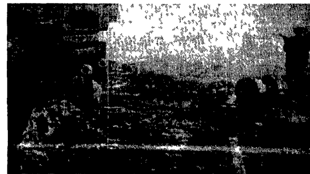
Scontri a Belfast fra soldati inglesi e manifestanti dell'Ira. A sinistra, Gerry Adams leader del Sinn Féin

di fronte a questo scempio senza fine che cosa fa la diplomazia internazionale? In primo piano emerge l'ambiguità cautele di Israele che sabato notte a sera altri 38 morti e 178 feriti Beirut è ormai una città fantasma di un milione e mezzo di abitanti.