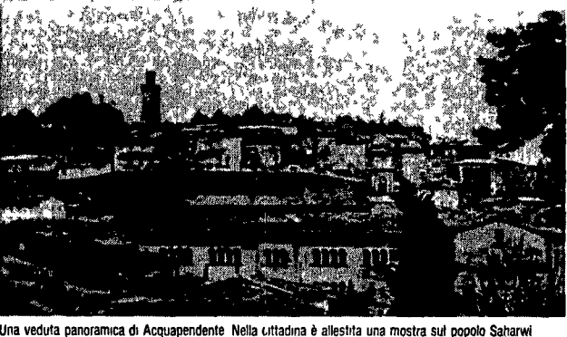
Una veduta panoramica di Acquapendente. Nella cittadina è allestita una mostra sul popolo Saharwi