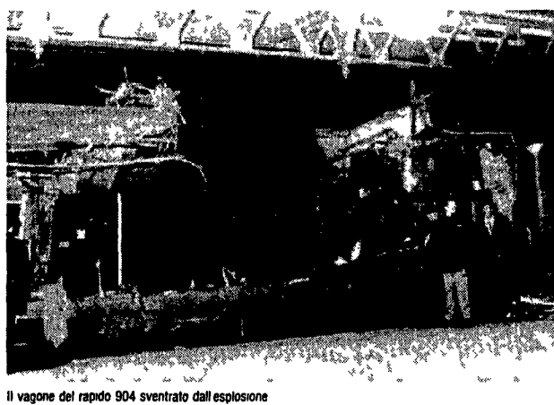
Il vagono del rapido 904 sventrato dall'esplosione