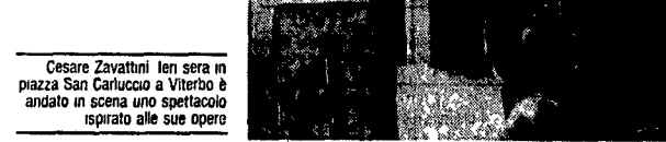
Cesare Zavattini ieri sera in piazza San Carlo a Viterbo è andato in scena uno spettacolo ispirato alle sue opere

de la Souris di Parigi i ragazzi si «impadroniranno» della città scatenandosi per le vie - il 31 alle 18 da piazza delle Erbe - e realizzando «Spettacolo» nel centro storico. Il teatro di piazza San Carlo è per la prima volta - allernano i ragazzi della cooperativa Il Malusago - cento mimi provenienti da tutta Europa e con esperienze diverse collaboreranno per dar vita a una spettacolare performance.