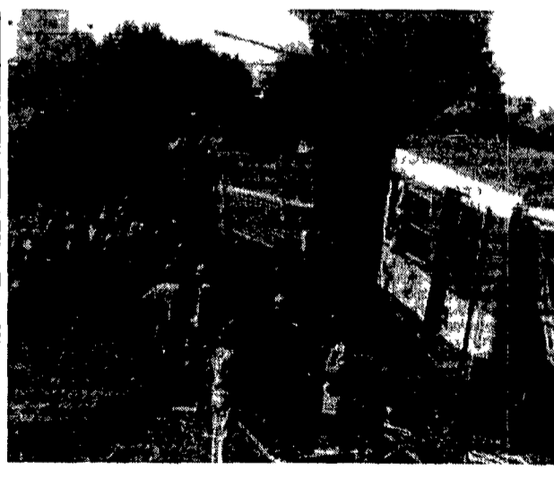
In Austria si scontrano due treni Un morto