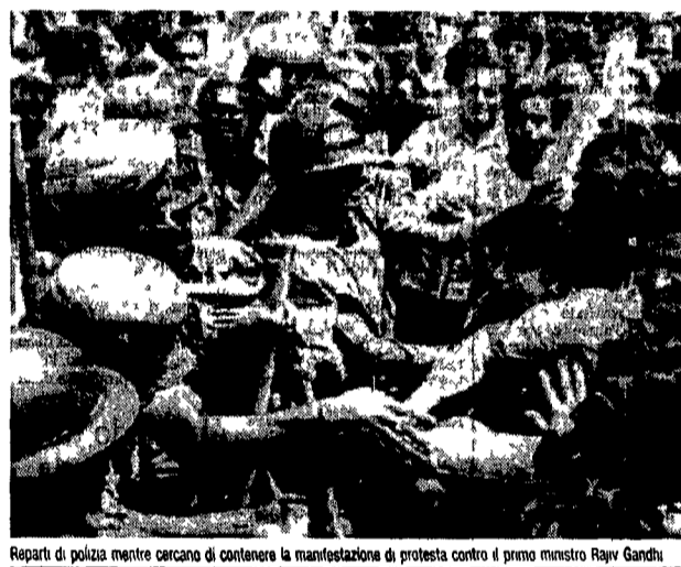
Reparti di polizia mentre cercano di contenere la manifestazione di protesta contro il primo ministro Rajiv Gandhi