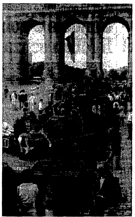
BRUXELLES. Famiglie in tenuta domenicale si impossessano di tank e carri armati della seconda guerra mondiale. Il 3 settembre a Bruxelles si celebra il 45° anniversario della liberazione della città da parte delle truppe britanniche.