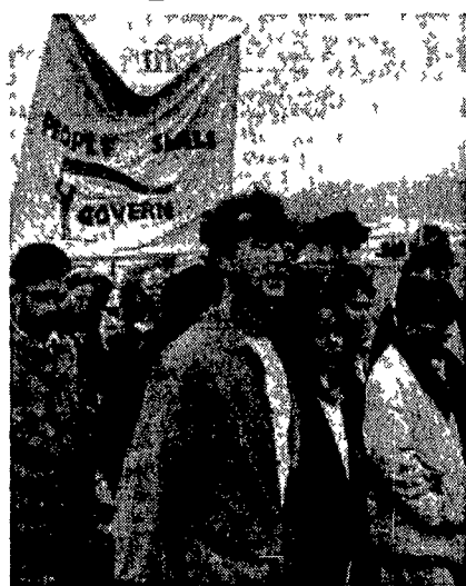
Giovani bianchi e neri manifestano a Città del Capo