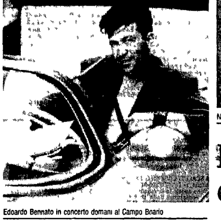
Edoardo Bennato in concerto domani al Campo Boario