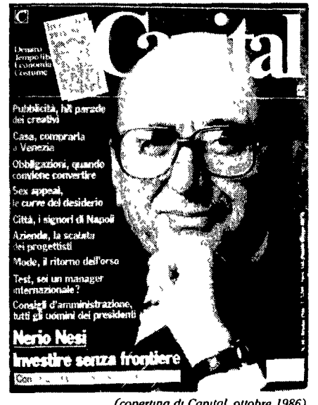
(copertina di Capital, ottobre 1986)

L e corna dell'automobilista sono sgradevoli perché esprimono uno stile di vita superato. Ci ricordano un mondo di passioni un po' tribali. Un mondo da cui noi moderni tendiamo a distaccarci con la civiltà delle buone maniere, con la dignità nazionale e l'autocontrollo personale in famiglia.