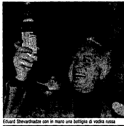
Eduard Shevardnadze con in mano una bottiglia di vodka russa