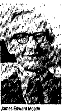
James Edward Meade