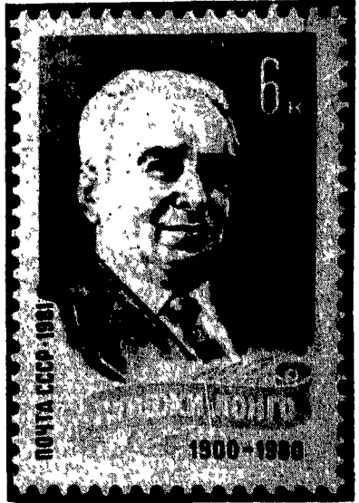
Questo francobollo commemorativo delle poste sovietiche, del valore di sei copechi, prova la pesante compressione di Luigi Longo con il regime brezneviano. Nella stessa serie, dedicata alle grandi personalità di quegli anni, compaiono anche Fulvio Collovati (dieci copechi), U-Thant (dodici copechi), Adriano Celentano (quindici copechi), Raimondo Vianello (venti copechi), Nantas Salvalaggio (trenta copechi) e Braccobaldo (quaranta copechi). Il pezzo da un copeco, il famoso «Trombadori rosa», è ormai introvabile.

Impedita la pubblicazione di un nuovo articolo di Biagio De Giovanni: