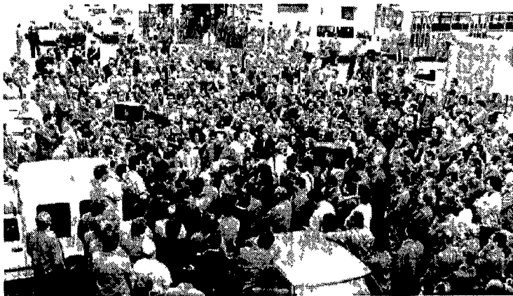
I lavoratori dell'Atac ascoltano Achille Occhetto al deposito Prenestino sotto il segretario del Pci con l'esponente di una associazione di handicappati

Incontri con i lavoratori e nei quartieri popolari «Critichiamo certi appelli di autorità religiose, i cattolici devono poter scegliere liberamente Il Psi attacca tutti tranne la Dc di Sbardella»