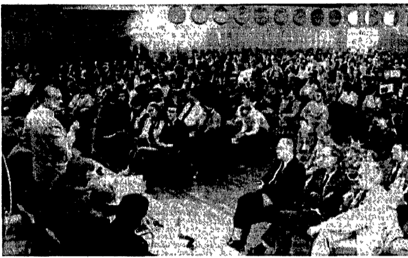
Anche ieri centomila persone hanno chiesto a Lipsia «elezioni libere e democrazia».