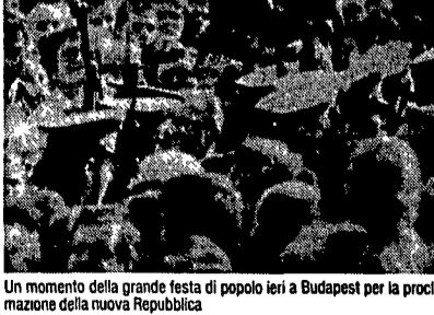
Un momento della grande festa di popolo ieri a Budapest per la proclamazione della nuova Repubblica