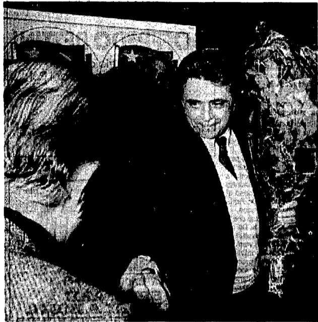
Il segretario del Pci, Achille Occhetto, a Trastevere

Occhetto tra i bambini e i genitori protagonisti della «ribellione» contro l'«affare mense» che ha cacciato dal Campidoglio Giubilo. L'incontro ieri pomeriggio davanti alla scuola «Regina Margherita», a Trastevere. «Non avete piegato la testa, avete rifiutato di farvi ridurre a sudditi», ha detto Occhetto. Tanti genitori candidati nelle liste del Pci: «È l'unico partito che ci ha ascoltato».